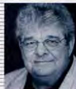
JESPER JUUL ist dänischer Familientherapeut. Zuletzt erschien sein Buch »Pubertät: Wenn Erziehen nicht mehr geht«