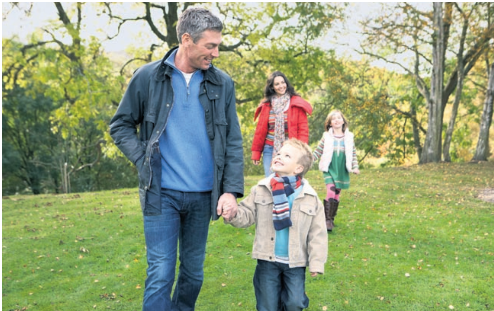
In der Erziehung alles richtig zu machen, ist unmöglich. Jesper Juul rät Eltern jedoch, ihren Kindern offener und gelassener zu begegnen.

Erziehung ist ein Entwicklungsprozess, in dem die Beteiligten – Eltern und Kinder – voneinander lernen.